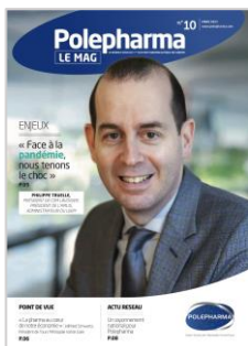
Le Mag n°10 – Mars 2021